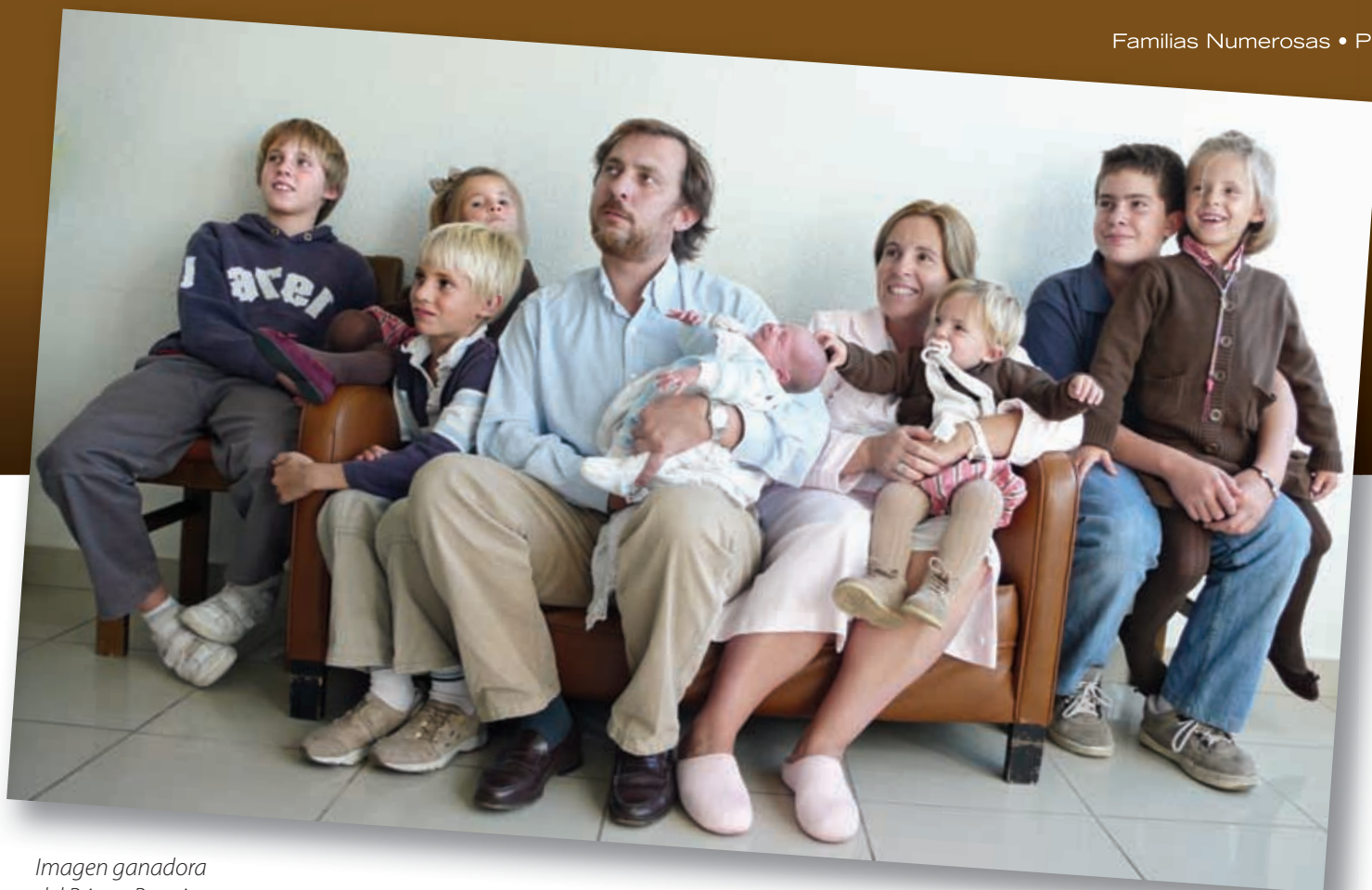
Imagen ganadora del Primer Premio

co, prestigiosa marca española de moda infantil, que cuenta con más de 100 puntos de venta en España y está también presente en países como Portugal, México y Luxemburgo, con ropa, calzado y complementos para niños de 0 a 14 años.